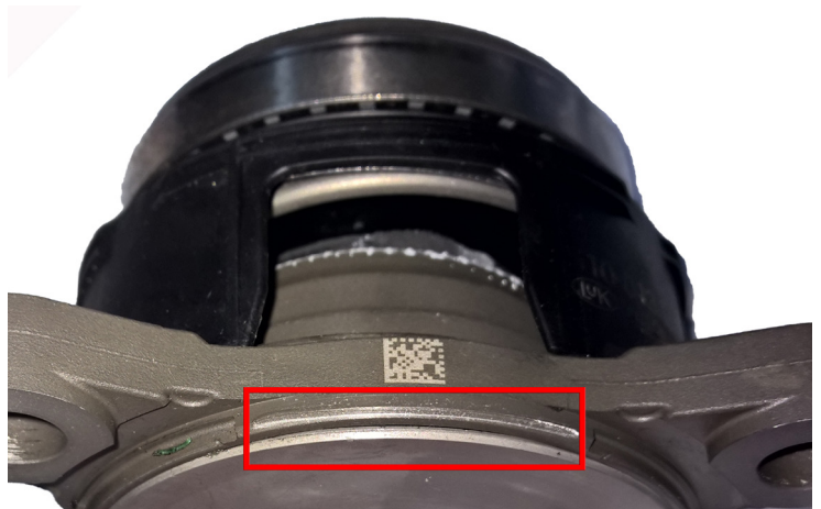
Fig. 2: Cuadro de averías de un mecanismo central de desembrague con disco obturador suelto