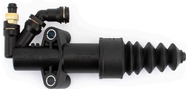
Εικόνα 2: Δευτερεύουσα αντλία συμπλέκτη 512 0050 10 (έκδοση 2)

Στην έκδοση 1 (Εικ. 1), η υδραυλική γραμμή του οχήματος μπορεί να συνδεθεί απευθείας στην αντλία του συμπλέκτη, χρησιμοποιώντας τον προσαρμογέα του. Για την εξαέρωση, μετακινήστε το κάτω κλιπ συγκράτησης, στη πρώτη του θέση και τραβήξτε ελαφρώς τον σύνδεσμο από το περίβλημά του. Μετά την εξαέρωση, επιστρέψτε το στην αρχική του θέση και κλειδώστε το κλιπ συγκράτησης.