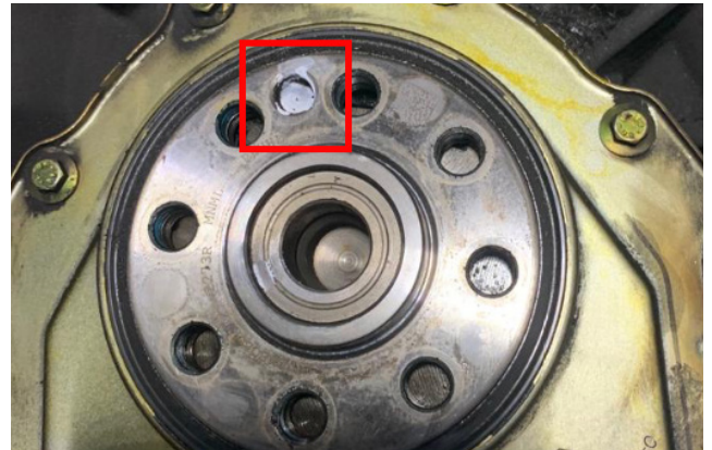
Εικόνα 2: Εσοχή στον στροφαλοφόρο άξονα

Το Βολάν Διπλής Μάζας σε αυτές τις εφαρμογές, διαθέτει έναν δακτύλιο αισθητήρα. Αυτό πρέπει να συγχρονίζεται σωστά με τον στροφαλοφόρο άξονα, ώστε το όχημα να ξεκινάει και να λειτουργεί σωστά. Σε αντίθεση με έναν συμβατικό πείρο ασφάλισης, συγχρονίζονται μέσω μιας οπής στο ΒΔΜ (εικόνα 1) και μιας εσοχής στον στροφαλοφόρο άξονα (εικόνα 2).