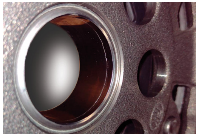
Image 2 : Plissement de matériau à faible saillie sur la bride de roulement

Respecter les préconisations du constructeur du véhicule!