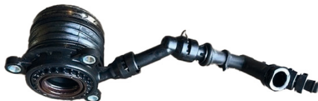
Figure 1 : Conduite hydraulique de la butée hydraulique (CSC) en plastique

Une butée hydraulique d'embrayage en plastique défectueuse (Fig. 1) ne peut pas être remplacée par la nouvelle version en métal (510 0183 10) sans le changement d'une nouvelle conduite hydraulique adaptée. Dans cette configuration, la conduite hydraulique en métal les différentes pièces permettant le guidage et les raccords du constructeur du véhicule (Fig. 2) doivent être utilisées.