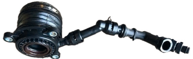
Afbeelding 1: Hydrauliekleiding van de kunststof CSC

Een defect kunststof centraal ontkoppelinglager (afb. 1) kan niet worden vervangen door de huidige metalen uitvoering (510 0183 10) zonder een nieuwe hydraulische verbindingleiding. In dit geval moeten de metalen hydrauliekleiding en diverse geleidings- en verbindingsonderdelen van de voertuigfabrikant (afb. 2) worden gebruikt.