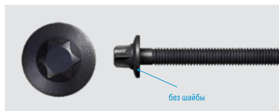
Рисунок 2_Новый болт без шайбы (OE-№ 65 07 937)

VICTOR REINZ – простейший путь получения хорошего уплотнения.