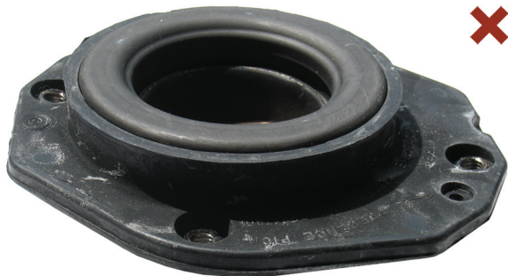
Fig. 1 : Supporto superiore dell'ammortizzatore montato in modo scorretto

Citroën Berlingo / Xsara / ZX Peugeot 306 / Partner