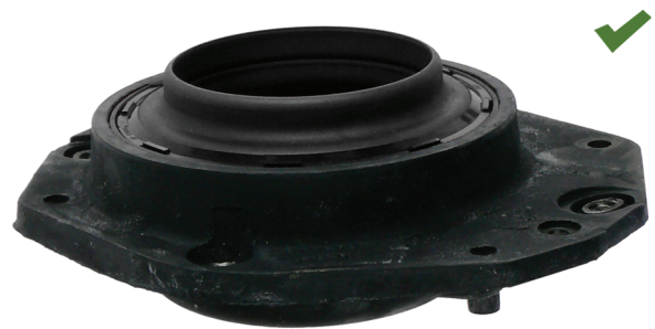
Fig. 2: Supporto superiore dell'ammortizzatore montato in modo corretto