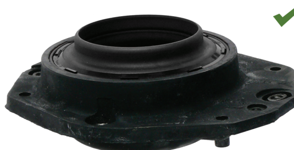
Fig. 2: Apoio superior do amortecedor montado correctamente