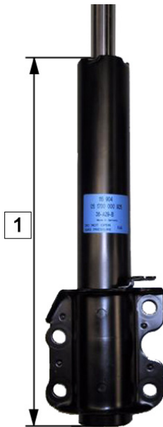
Rys. 1: Przednia oś

Nr art.: 124 654, 290 377, 290 378, 290 379, 290 403, 290 955