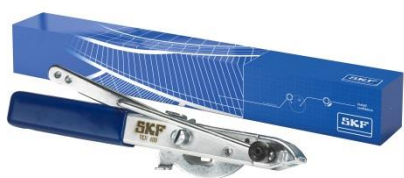
Kleště na aplikaci spon: VKN 400

Při montáži univerzální manžety na kloub se doporučuje po utažení upínací spony manžetu oříznout na odpovídající velikost manžety.