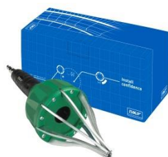
Ferramenta expansora: VKN 402

Para uma reparação profissional, aquando do aperto das abraçadeiras, é recomendado o uso da ferramenta VKN 400.