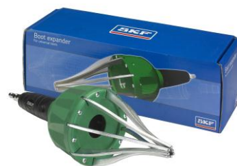
Ecarteur de soufflet : VKN 402

Le VKJP 01010 est fabriqué à partir d'un mélange caoutchouc de haute qualité permettant ainsi un montage en toute fiabilité avec l'écarteur de soufflet pneumatique SKF VKN 402 sans avoir à démonter le joint homocinétique.