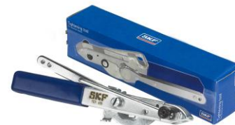
Pince de serrage : VKN 400

Pour un serrage rapide et fiable, SKF recommande l'utilisation de la pince de serrage pour colliers universels, le VKN 400. Un serrage incorrect des colliers peut provoquer une usure prématurée du joint homocinétique !