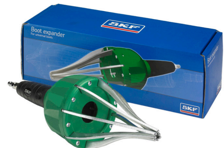
Εργαλείο διαστολής: VKN 402

Η φούσκα VKJP 01010 είναι κατασκευασμένη από υλικό μεγάλης ελαστικότητας και μπορεί να τοποθετηθεί εύκολα και γρήγορα με το ειδικό εργαλείο αέρος VKN 402, χωρίς την εξαγωγή του μπιλιοφόρου από τον άξονα.