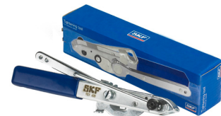
Εργαλείο σύσφιξης: VKN 400

Για την σύσφιξη των κολιέδων, προτείνουμε την χρήση του ειδικού εργαλείου VKN 400, μιας και η λανθασμένη σύσφιξη των κολιέδων σημαίνει μέχρι και την καταστροφή του μπιλιοφόρου!