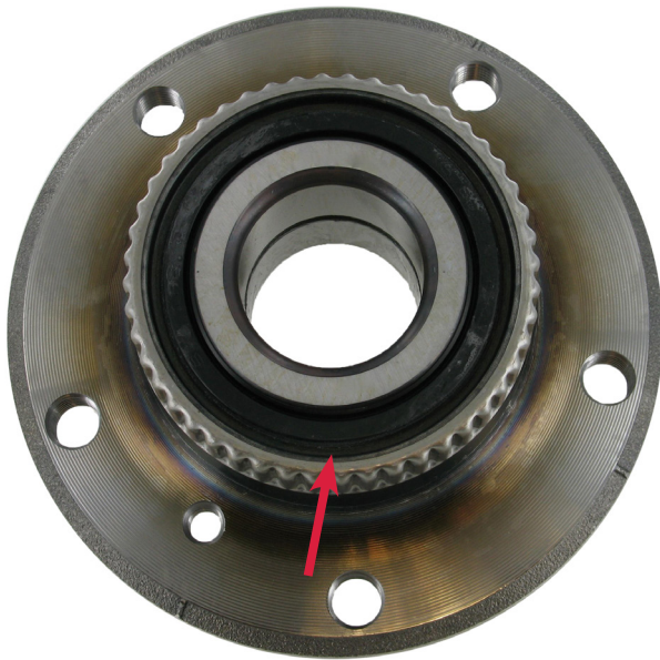
VKBA 3667 – met metalen afdichting

Een ander, alleen optisch verschil, is de afdichting toegepast aan de binnenzijde van het lager. SKF past een metalen afdichting toe daar waar sommige nadere leveranciers een rubber afdichting gebruiken.