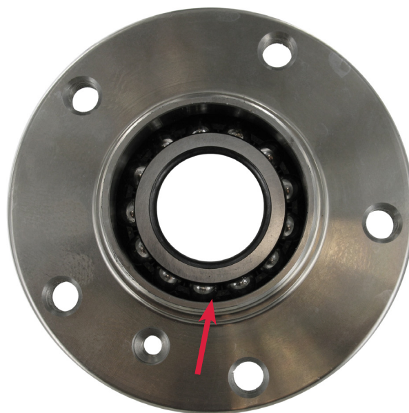
Sommige leveranciers – met afdichting wielzijde

De afdichting aan de wielzijde is niet nodig daar de afdekkap, zoals in de SKF set aanwezig is, volledig afdoende is om het lager af te sluiten na montage op het voertuig. Deze oplossing is ontwikkeld naar OEM specificaties en wordt door Autofabrikanten frequent toegepast.