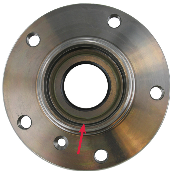
VKBA 3667 – zonder afdichting

Het SKF lager in de set VKBA 3667 is niet uitgerust met een afdichting aan de wielzijde van het lager ( zie afbeeldingen hieronder) zoals bij sommige andere leveranciers het geval is.