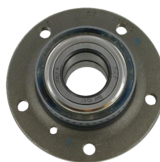
SKF konstrukcija sa kasetnom-zaptivkom i bez žljeba za štitnik od prašine