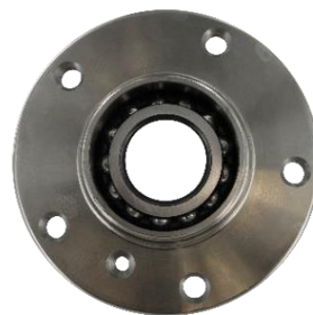
SKF konstrukcija ležaja bez spoljne zaptivke