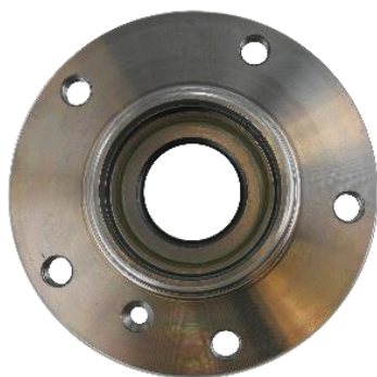
Aftermarket konstrukcija ležaja sa spoljnom zaptivkom

SKF ležaj je unapred podmazan i u potpunom je skladu sa OE kvalitetom proizvoda i performansama.