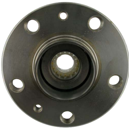
Rodamiento con manguito de plástico

SKF utiliza soluciones de embalaje seguras para proteger el rodamiento de rueda de daños durante el transporte. El kit VKBA 3693 se suministra con un manguito de plástico, para mantener unidos los aros del rodamiento hasta su montaje en el vehículo.