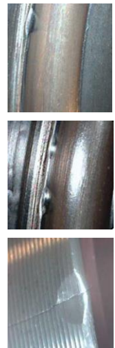
Lagerschäden auf Grund von Einbaufehlern

Die Kraft darf nur auf den Lageraußenring ausgeübt werden, um das Lager nicht zu beschädigen.