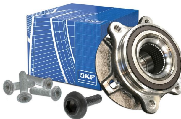
VKBA 6649 F