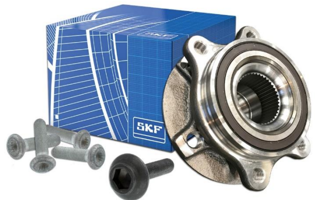
VKBA 6649 F