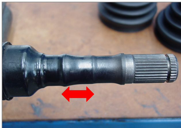
Εικ. 4 – Περιοχή τοποθέτησης της μικρής διαμέτρου της φούσκας. Στην περιοχή πρέπει να τοποθετείται η μικρή διάμετρος και στη συνέχεια να εφαρμόζει η σφικτήρας.