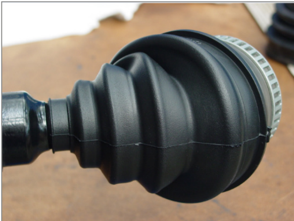
Εικ. 1 – Μικρή διάμετρος τοποθετημένη σε λάθος σημείο

Κατά την τοποθέτηση της φούσκας, αν ο σφικτήρας στην πλευρά μικρής διαμέτρου τοποθετηθεί σε λάθος περιοχή (Εικ.1), η φούσκα θα εκτείνεται περισσότερο από το επιθυμητό κατά το στρίψιμο με αποτέλεσμα να κοπεί (Εικ.2) ή να φθαρεί πρόωρα. Προσοχή στην περιοχή τοποθέτησης της μικρής διαμέτρου στον άξονα του ημιαξονίου (Εικ.4).