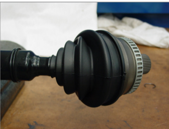
Εικ. 3 – Μικρή διάμετρος τοποθετημένη σε σωστό σημείο