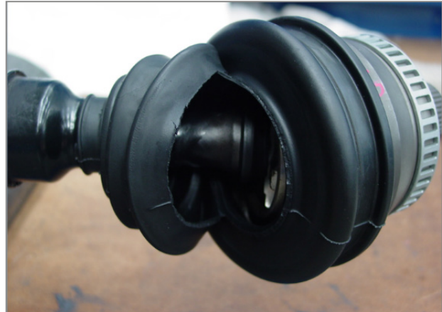
Εικ. 2 – Σπάσιμο φούσκας κατά το στρίψιμο