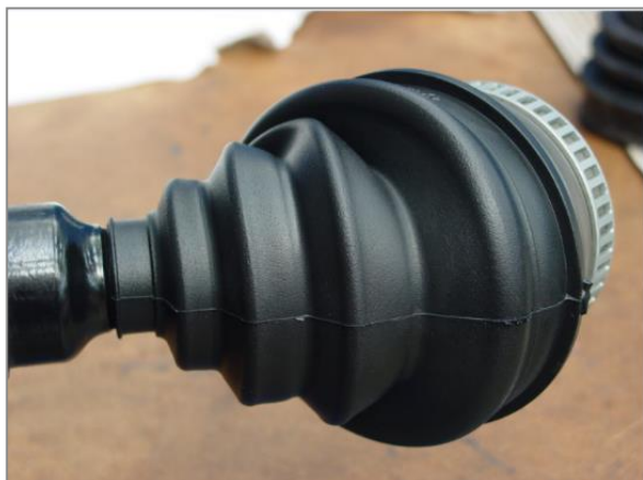
Fotografija 1 – Nepravilno postavljanje

Ako je manji promjer manžete postavljen preblizu vratila poluosovine, žljebovi na manžeti mogu puknuti. Ako je manžeta postavljena predaleko (fotografija 1), istezanja će biti ekstremna i mogu izazvati puknuća (fotografija 2).