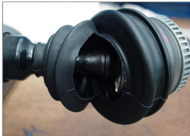
Slika 2 – Pretrganje pri napačnem privijanju