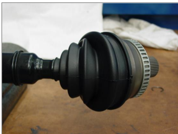
Slika 3 – Pravilen položaj za privijanje