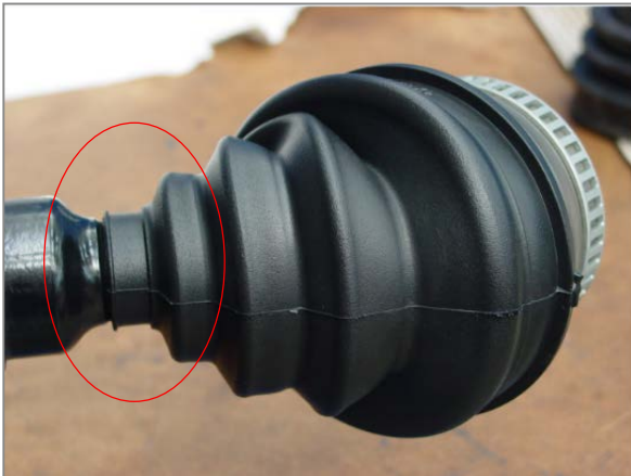
Εικ.1 Λάθος σημείο τοποθέτησης μικρής διαμέτρου

Εάν η πλευρά με την μικρή διάμετρο της φούσκας τοποθετηθεί σε λάθος σημείο (Εικ.1,5), τότε η φούσκα κατά το στρίψιμο τερματίζει με αποτέλεσμα να κόβεται, όπως φαίνεται παρακάτω (Εικ.2).