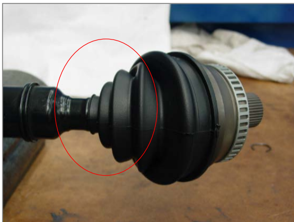
Εικ.3 Σωστό σημείο τοποθέτησης μικρής διαμέτρου