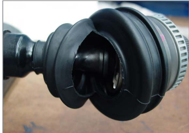
Εικ.2 – Αποτέλεσμα: Σπάσιμο φούσκας