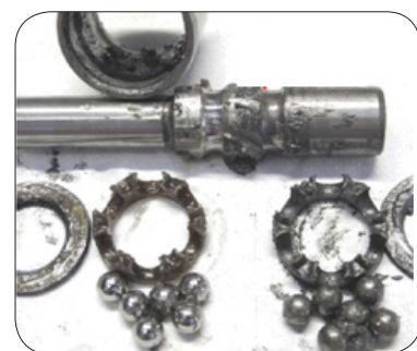
Exemples d'une pompe à eau endommagée :