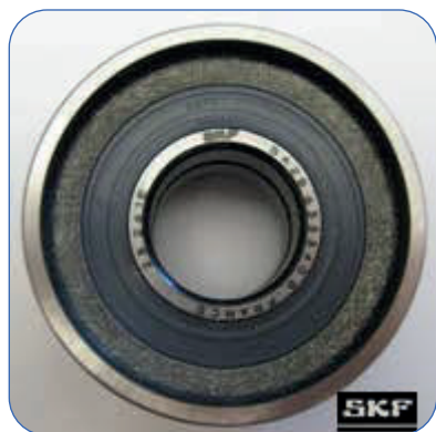
Gammel OE/SKF-design 2 innerringer