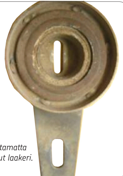
Muovikannen asentamatta jättämisestä kulunut laakeri.

Jos UUTTA kantta ei asenneta asianmukaisesti laakerin säädön jälkeen, vaara epäpuhtauksien pääsyyn laakeriin on suuri! Tämä lyhentää huomattavasti kiristimen käyttöikä!