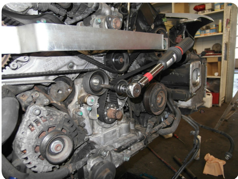
1. sz. kép