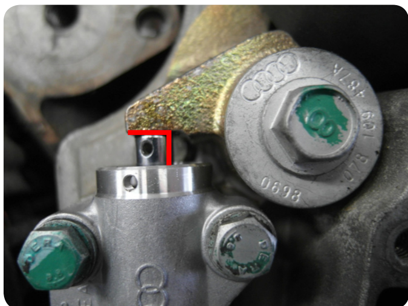
2. sz. kép