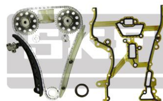
Состав комплекта цепи ГРМ SKF

Компания General Motors внесла ряд конструктивных изменений в два вида звездочек распределительных валов, устанавливаемых на указанные выше позиции. Первый вариант монтажа — это звездочки из спечённого материала со встроенными шайбами, а второй — звездочки из штампованного материала без шайб. В настоящее время General Motors предлагает исключительно новую конструкцию.