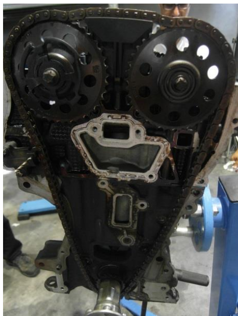
Вариант монтажа № 1 до номера двигателя 19DN0327

Следуя проведенным General Motors конструктивным изменениям, SKF на данный момент предлагает две отдельные шайбы для обоих вариантов монтажа.