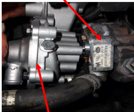
Pumpa za vodu