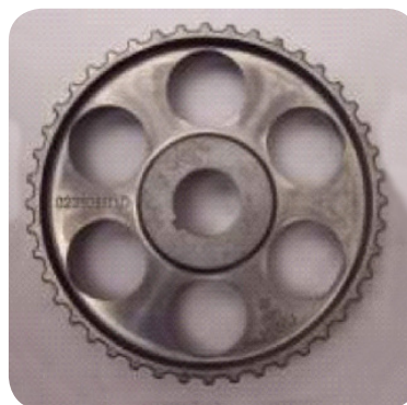
Obr 2: OE #: 023 109 111 D