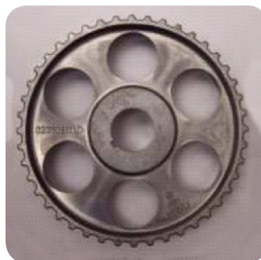
Εικ. 2: OE #: 023 109 111 D

® Η SKF αποτελεί σήμα κατατεθέν του Ομίλου SKF.