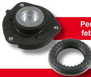
Ремкомплект febi № 22502