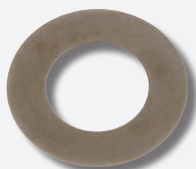
Arandela con recubrimiento de diamante

Para evitar caros daños consecuenciales, la arandela con recubrimiento de diamante ya está incluida en los juegos de reparación de amortiguadores febi para Volvo 850, S70, S80, V70 I, V70 II, VW Crafter/T4 y Audi A6.