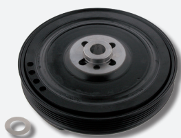
Rep. set poelie