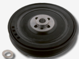
Polia da cambota com amortecimento torsional