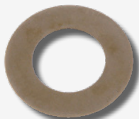
Anilha da cambota com revestimento diamante

A anilha da cambota da febi possui um revestimento de níquel-diamante de alta qualidade que evita o deslizamento da polia. Adicionalmente, é garantida uma ótima transmissão de potência. A fim de evitar danos consequentes e dispendiosos, os kits da polia febi para o Volvo 850, S70, S80, V70 I, V70 II, VW Crafter / T4 e Audi A6 incluem a anilha de cambota com revestimento diamante.