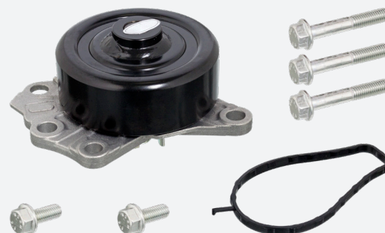
VERSIUNE NOUĂ - febi 32682