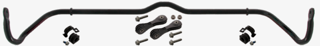
الصورة 2 مجموعة الموازن مع محامل وأذرع الربط febi 36630

لهذا السبب تقدم شركة febi مجموعة الموازن لسيارة VW Golf IV مثلاً febi 36630 (أنظر الصورة 2)، التي تحتوي الى جانب مجموعة التركيب على الموازن أيضاً. تتيح هذه المجموعة عملية تصليح مهنية متقنة وتمنع بذلك الشكاوي. فهذا يوفر على العملاء زيارة ورش التصليح والوقت والمال!