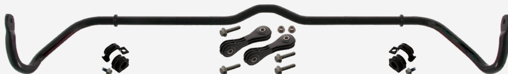
Рис. 2 Комплект стабилизатора со втулками и соединительными тягами febi № 36630

По этой причине febi предлагает комплект стабилизатора, например, для VW Golf IV febi № 36630 (рис. 2), который включает в себя не только втулки, тяги стабилизатора и монтажный комплект, но и сам стабилизатор. Этот комплект делает возможным осуществлять квалифицированный ремонт и предотвращать возможные рекламации. Это сэкономит СТО и клиентам время и деньги!