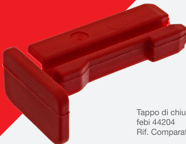
Tappo di chiusura per astina livello febi 44204 Rif. Comparativo 140 991 00 55

Usare uno strumento appropriato per spezzare il cappellino del perno di bloccaggio prima di misurare il livello dell'olio (Fig. 2); rimuovere il perno di bloccaggio e quindi togliere il tappo di chiusura (Fig. 3).