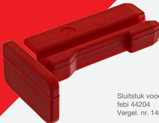
Sluitstuk voor oliepeilstok febi 44204 Vergel. nr. 140 991 00 55

Voor de meting moet de schijf van de borgpen met passend gereedschap worden losgebroken, de borgpen moet verwijderd worden en de vuldop moet er worden afgehaald (Afb.3).