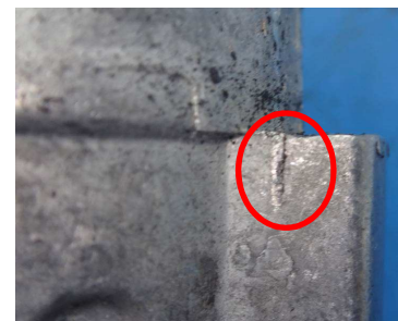
Aspect de la butée

Usure et/ou Rupture du galet tendeur: le GA357.24 n'est pas conçu pour absorber les chocs violents de la courroie.