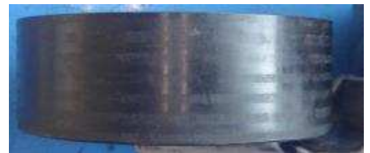
Aspect de la poulie

Ejection de la courroie d'accessoires des gorges des différentes poulies: Elle s'est donc décalée puis désalignée. Le surmoulage polyamide du diamètre d'enroulement de la poulie est marqué.