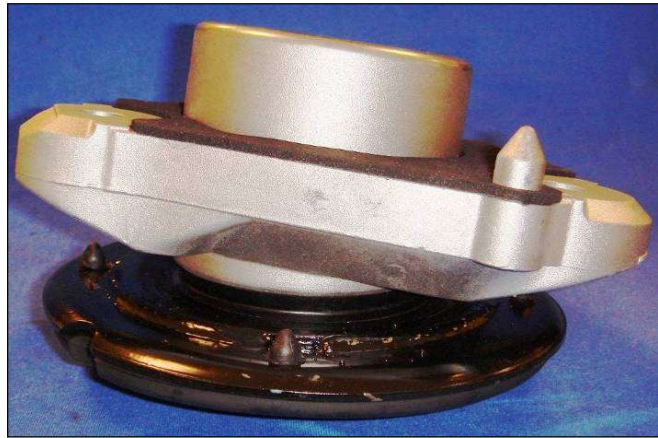
Darstellung im eingebauten Zustand