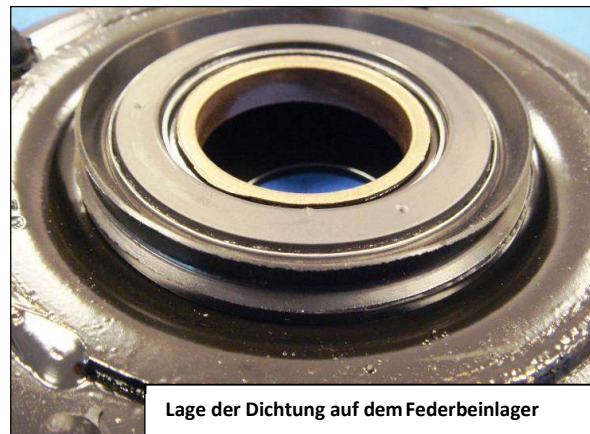
Lage der Dichtung auf dem Federbeinlager