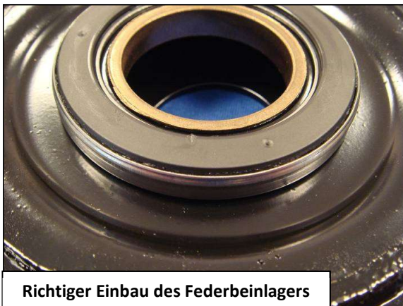
Richtiger Einbau des Federbeinlagers

Auf die richtige Einbaulage des Lagers achten: Die Metallseite darf von oben nicht sichtbar sein