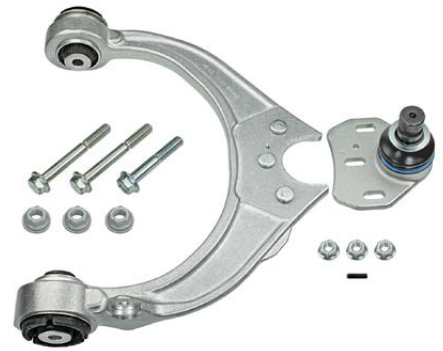
Núm. MEYLE: 316 050 0033/HD Núm. corto: MCA0460HD

Una rótula de conducción de rueda, regulable sin escalones, permite una perfecta alineación: