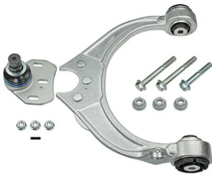
Núm. MEYLE: 316 050 0034/HD Núm. corto: MCA0461HD