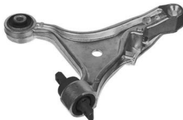
S60 + V70 II Арт. MEYLE 516 050 0017/HD (Короткий № MCA0665HD) 516 050 0018/HD (Короткий № MCA0666HD)