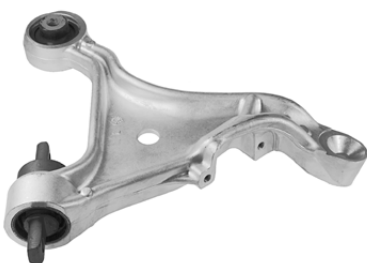
S80 Арт. MEYLE 516 050 0007/HD (Короткий № MCA0657HD) 516 050 0008/HD (Короткий № MCA0658HD)