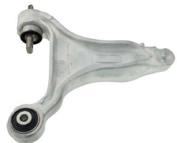
XC70 Арт. MEYLE 616 010 0005/HD (Короткий № MBJ0271HD)