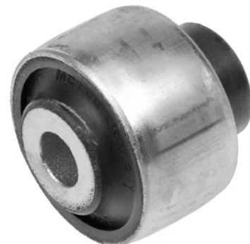
Арт. MEYLE 514 610 0005/HD (Короткий № MCB0283HD)