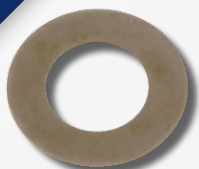
Podloška radilice sa dijamantskim premazom

SWAG setovi prigušivača vibracija za Volvo 850, S70, S80, V70 I, V70 II, VW Crafter/T4 i Audi A6 sadrže podlošku radilice sa dijamantskim premazom.