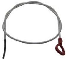
SWAG 10 93 8023