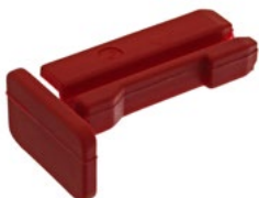
SWAG 10 94 4204