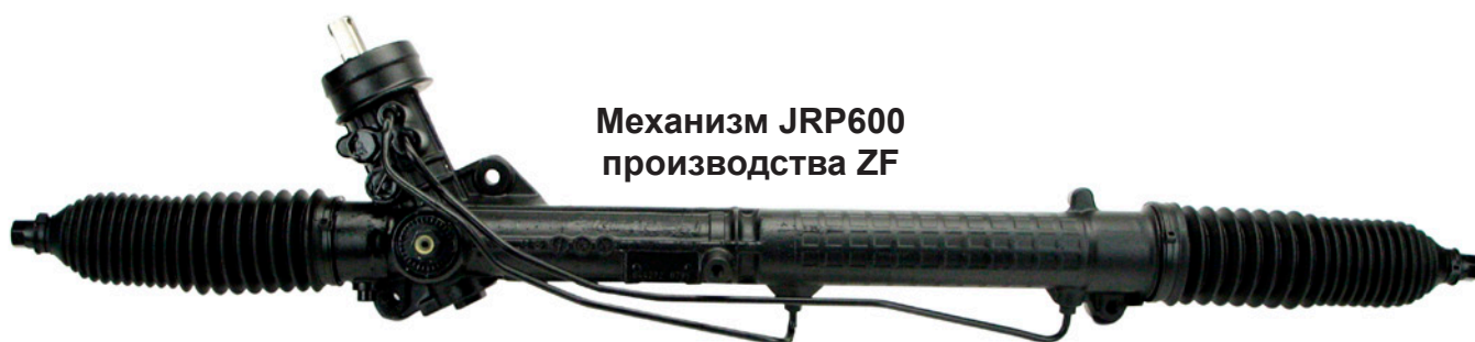
Механизм JRP600 производства ZF

То же самое относится к случаям возврата рулевых механизмов, бывших в употреблении. Независимо от того, какой именно механизм будет возвращен от клиента, клиент получает соответствующее возмещение. Критерии для возврата рулевого механизма перечислены ниже.