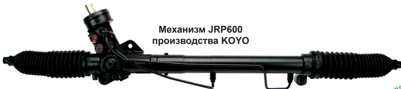
Механизм JRP600 производства KOYO