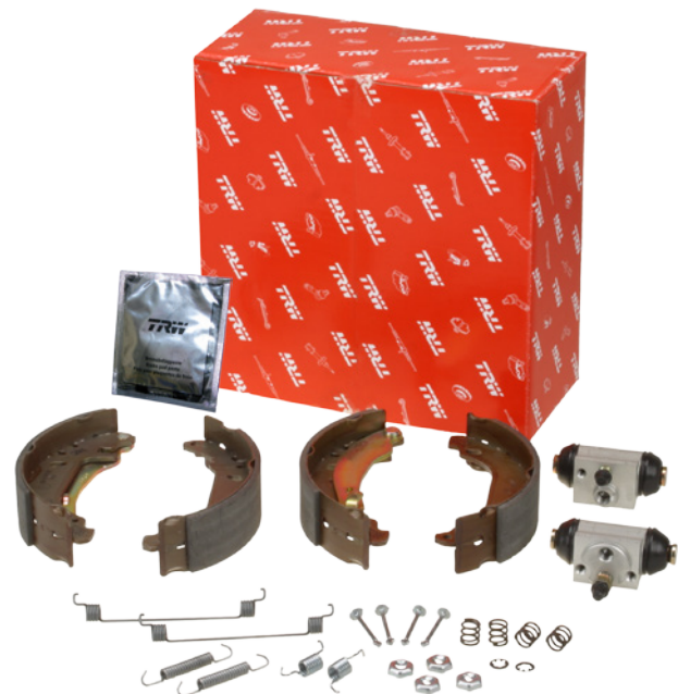
Kits de frein (BK)