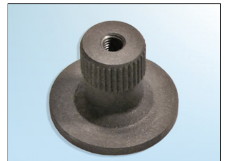
Fig 2: Adaptador 30648510 (OE)

Aplique el par de apriete especificado por el fabricante del vehículo para apretar los tornillos de fijación!